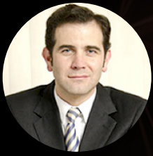
Lorenzo Cordova Vianello