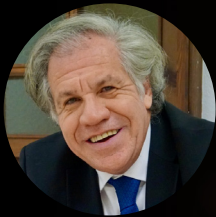
Luis Almagro Lemes

Luis Almagro fue reelegido para un segundo mandato como Secretario General de la OEA el 20 de marzo de 2020. Fue primero elegido Secretario General el 18 de marzo de 2015, con el apoyo de 33 de los 34 Estados Miembros y una abstención. Al asumir la conducción de la OEA, anunció que el buque insignia de su administración es “más derechos para más gente” y que trabajaría para “ser la voz de los que no tienen voz”.